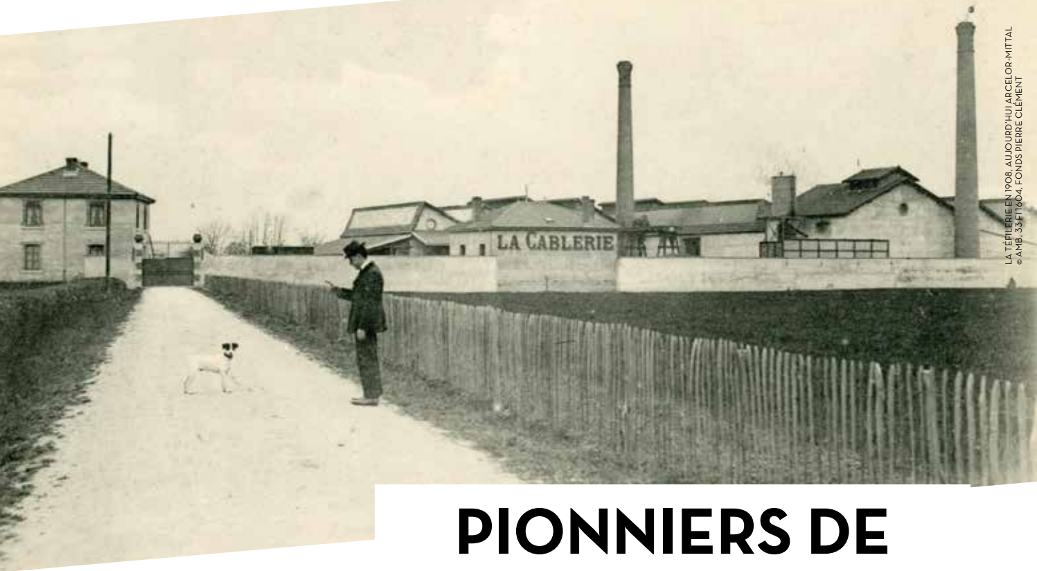
LA TÉFLERIE EN 1908. AUJOURD'HUI ARCELOR-MITTAL