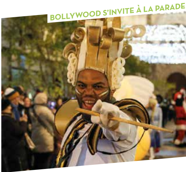
BOLLYWOOD S'INVITE À LA PARADE