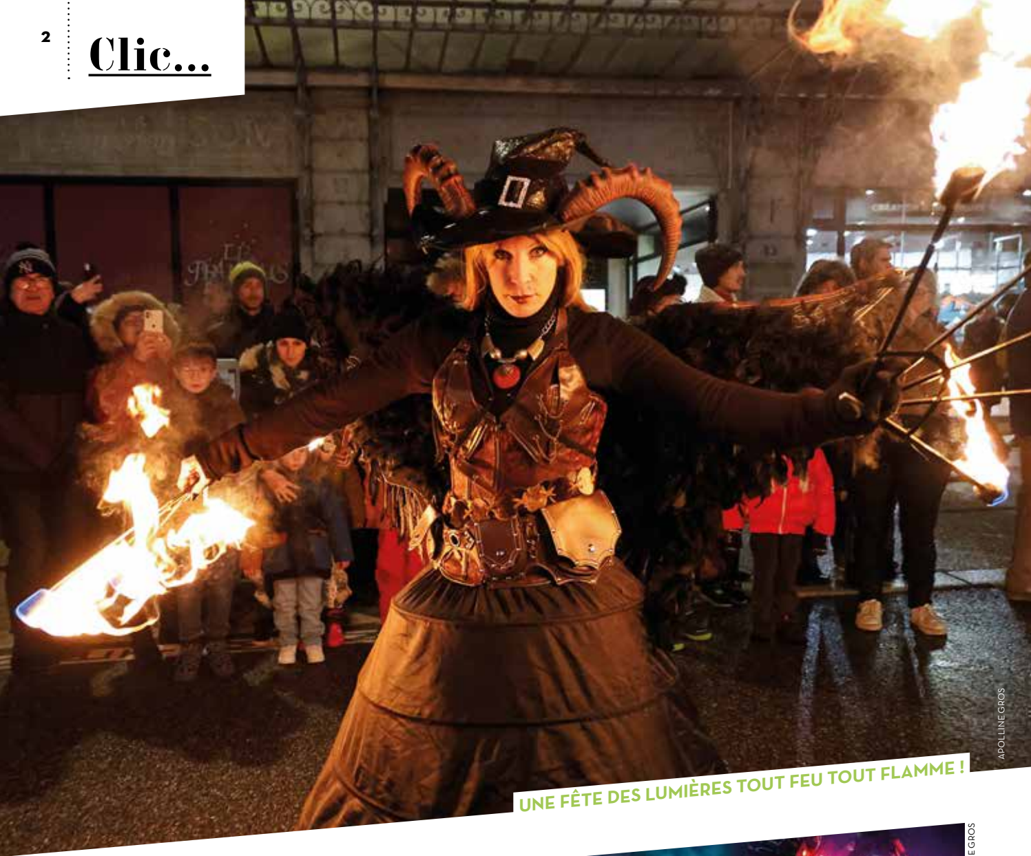
UNE FÊTE DES LUMIÈRES TOUT FEU TOUT FLAMME !