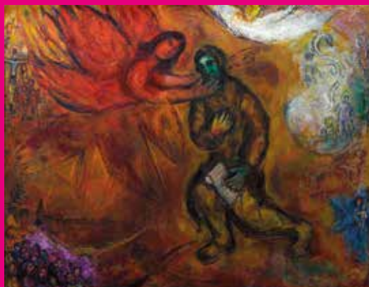
LE PROPHÈTE ISAÏE, MARC CHAGALL, 1968 © RMN-GRAND PALAIS (MUSÉE MARC CHAGALL), ADAGP / PHOTO GÉRARD BLOT

À travers le monde et le temps, l'humanité tente de percer les mystères de son avenir. Témoins du monde qui les entourent, les artistes se sont saisis de cette préoccupation du futur. Du Moyen Âge à l'époque contemporaine, plus de 80 œuvres européennes seront présentées lors de Prédictions, les artistes face à l'avenir . Oracles, prophètes et prophétesses, astrologie, cartomancie ou encore voyance interrogeront vos croyances et vos a priori . Une exposition en deux volets, à découvrir au monastère royal de Brou du 30 mars au 23 juin 2024 et à H2M-Espace d'art contemporain du 13 avril au 28 juillet 2024.