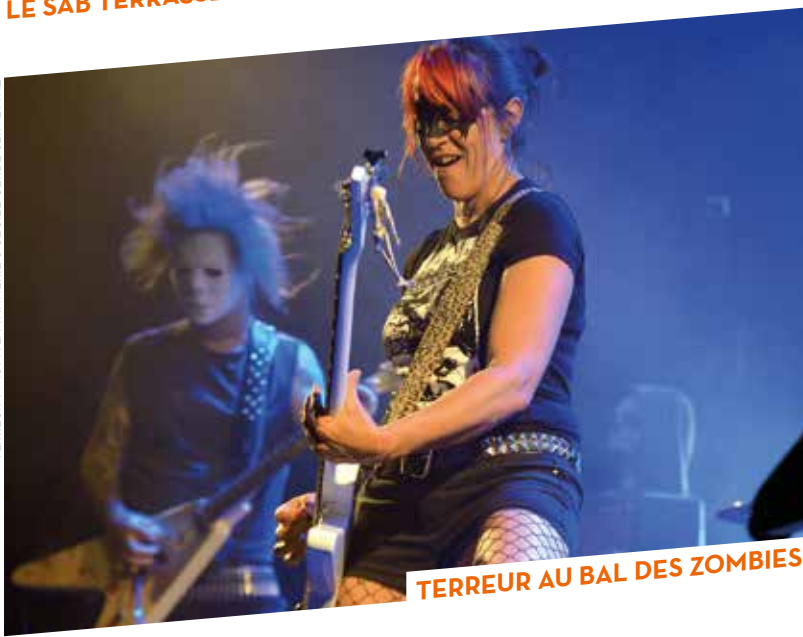
TERRUR AU BAL DES ZOMBIES