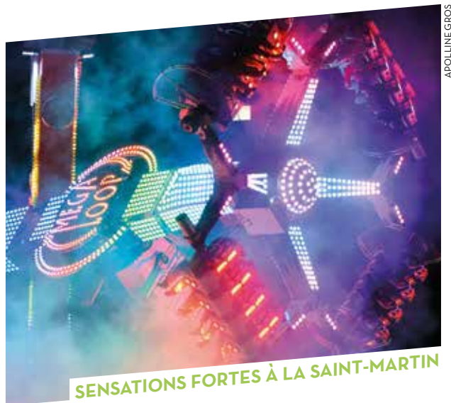
SENSATIONS FORTES À LA SAINT-MARTIN