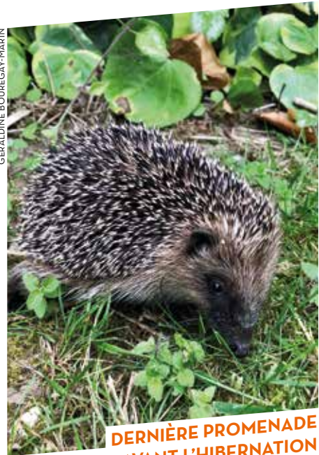
DERNIÈRE PROMENADE AVANT L'HIBERNATION