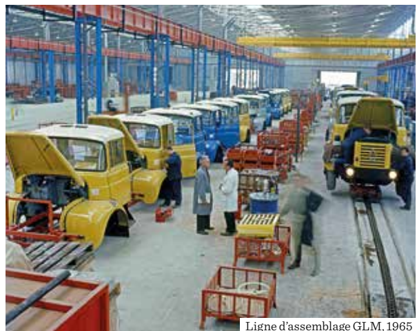
Ligne d'assemblage GLM, 1965