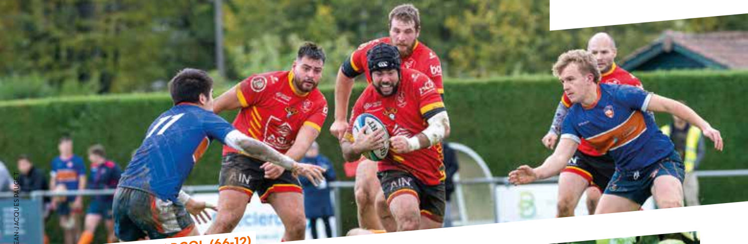
LE SAB TERRASSE ARCOL (66-12)