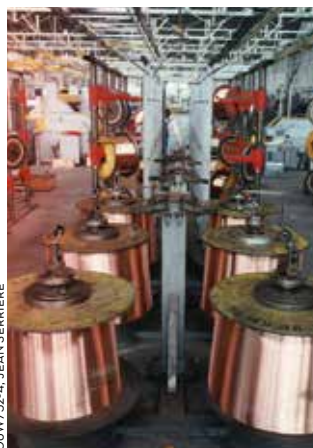
Les Câbles de Lyon en 1990, aujourd'hui Nexans

Dans le sillage de ce trio d'entreprises historiques, le tissu industriel de la ville de Bourg-en-Bresse s'est épaissi, avec les implantations des Câbles de Lyon en 1957, de Berliet en 1964... et diversifié. Agroalimentaire, mécanique, carrosserie industrielle, métallurgie... Bourg-en-Bresse a désormais de nombreux atouts industriels dans son jeu. Premier pôle poids lourds de France, 2 e pôle européen de carrosserie industrielle... son savoir-faire d'excellence s'exporte dans le monde entier et génère de nombreux emplois.