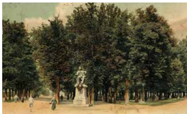
LES QUINCONCES ET LA STATUE EDGAR QUINET EN 1909