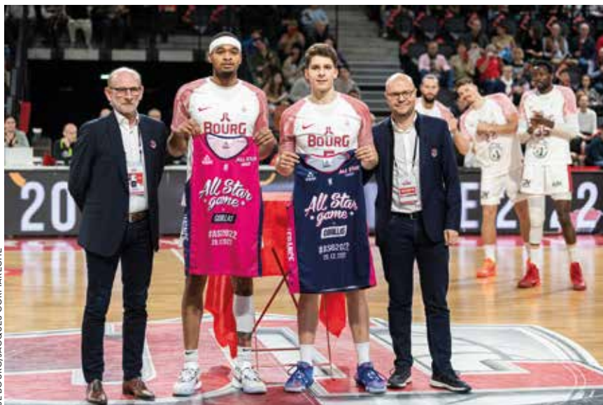
JL BOURG/JACQUES CORMARÈCHE