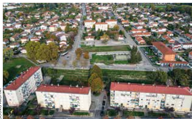
VUE DE LA PLACE JEAN-JACQUES ROUSSEAU AUX VENNES BOURG HABITAT

Bourg Habitat gère 5 600 logements répartis dans 30 communes et compte 11 600 locataires , dont 10 080 Burgiens. En ce début d'année, le bailleur social de l'agglomération a annoncé à ses collaborateurs et partenaires un changement de nom et de logo. Officiellement, Bourg Habitat deviendra le 1 er juin prochain Grand Bourg