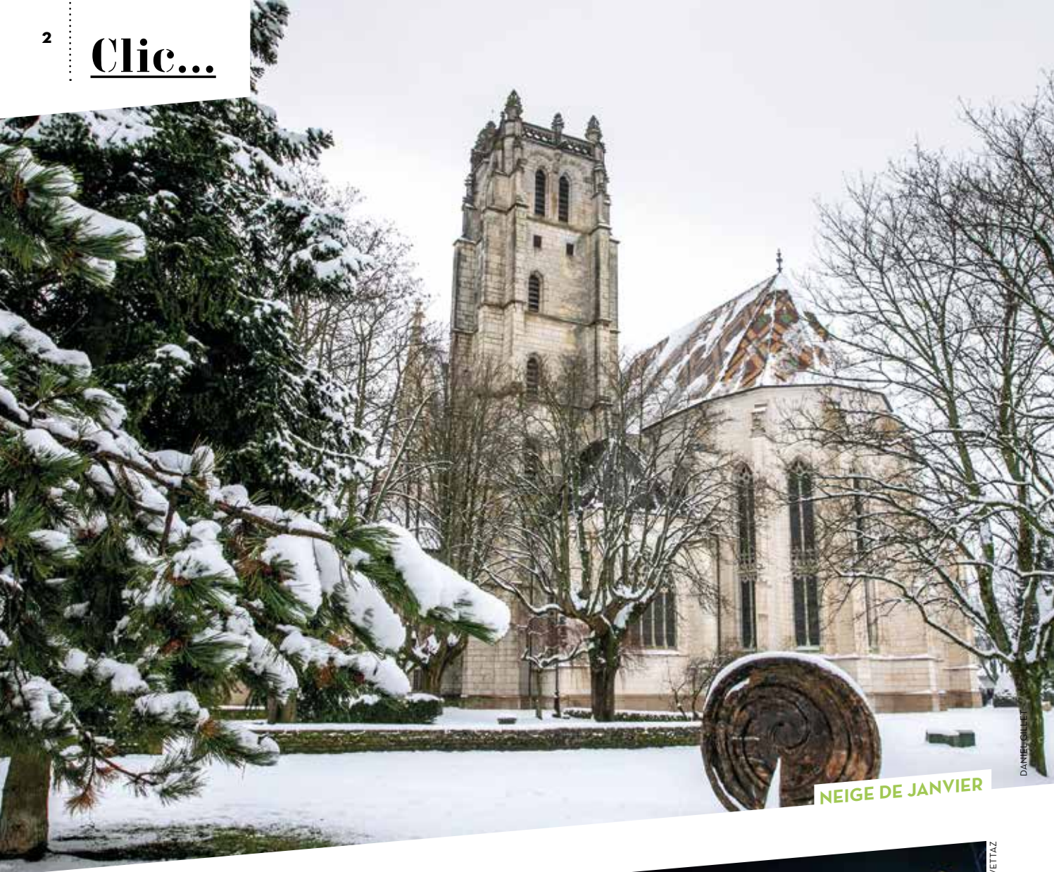
NEIGE DE JANVIER