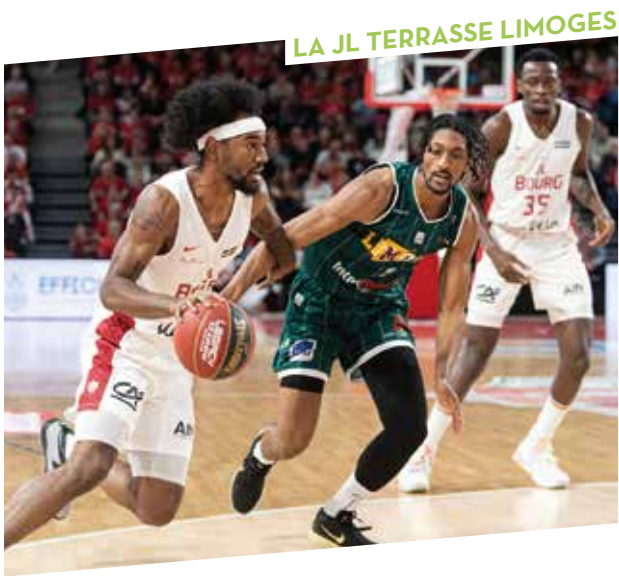
LA JL TERRASSE LIMOGES