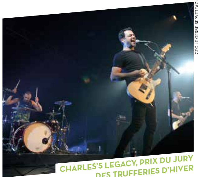
CHARLES'S LEGACY, PRIX DU JURY DES TRUFFERIES D'HIVER